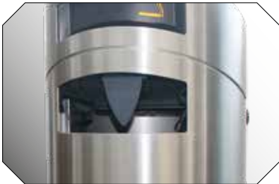
Individuell ausstattbar: Alle Modelle sind auf Wunsch mit Haizahn erhältlich.