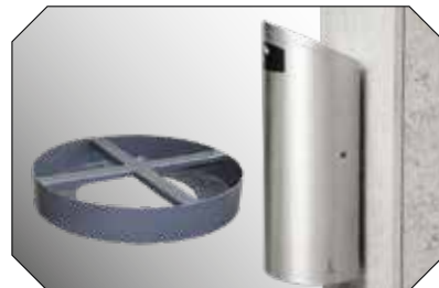
Flexibel: Wand- oder Stangenmontage. Felsenfest: Der Bodensockel kann angeschraubt oder mit Beton befüllt werden.