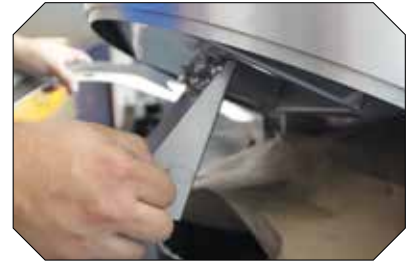
Sicher und effizient: einfache Entleerung der Ascherschale.