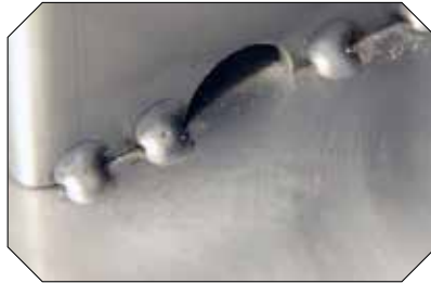
Robust: TIC- und Punktschweissung sorgen für Vandalensicherheit.