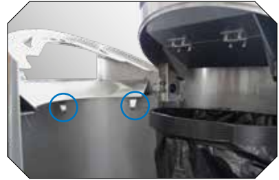
Schnell und bequem: Der Hai-Fix fixiert den Abfallsack automatisch.