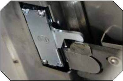
Tresorsicher: 5 mm Schloss mit Schnappverschluss und Tretsicherung, 3 Kant 8 mm.