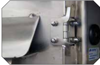
Hohe Qualität: hochwertige Scharniere aus Chromstahl mit Anschlagssperre.