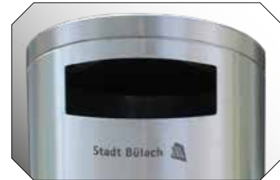
Individualisierbar: Alle Modelle können auf Wunsch mit Ihrem Logo oder Wappen versehen werden.