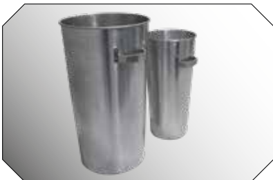
Modular: Auf Wunsch auch mit Innenbehälter aus Alu erhältlich.