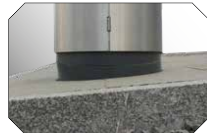
Anpassungsfähig: auf schrägem Gelände bis 27 % Gefälle montierbar.