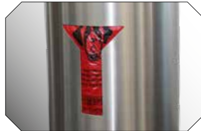
Gut zu Tier und Umwelt: Alle Modelle sind mit Hundekotbeutel-Dispenser ausstattbar.