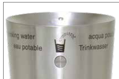
Der Trinkbrunnen sorgt entweder im Sparmodus mit einem Druckknopf oder permanent laufend ohne Knopf für ein angenehmes Trinkvergnügen.

Die Handhabung des Trinkbrunnens ist kinderleicht: Auf Knopfdruck sprudelt das frische Wasser aus der Düse des Trinkbrunnens Fontana. Als Alternative gibt es auch eine permanent laufende Lösung. Mit einem speziellen Dreikantschlüssel kann der Trinkbrunnen auf der Rückseite geöffnet werden ( wird mitgeliefert ).