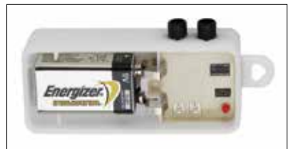
Legionellenschutz dank einstellbarem Spülmodul mit Intervallbetrieb von 0.5h bis 24h und Spüldauer von 10s bis 180s. Komplett autarkes System mit 9V Batteriebetrieb. Batterielebensdauer 1 Jahr.

Der Trinkbrunnen Fontana fügt sich in die Produktpalette von Designer und Erfinder Werner Zemp ein. Er ist damit die ideale Ergänzung zum Abfallhai und zu den Sitzbänken der ANTA SWISS AG. Alle Produkte dieser Linie werden aus hochwertigem Edelstahl gefertigt und sind durchdacht in Design und Funktion.