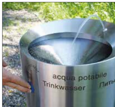
Geniessen Sie auf Knopfdruck frisches Wasser.

Sei es, um den Durst zu löschen oder um die Hände zu waschen: Unterwegs frisches Trinkwasser anzutreffen ist manchmal ein wahrer Segen. Mit dem Trinkbrunnen Fontana bietet die ANTA SWISS AG die optimale Lösung für den öffentlichen Raum. Denn dort, wo er steht, bietet er den Menschen jederzeit sauberes Wasser.